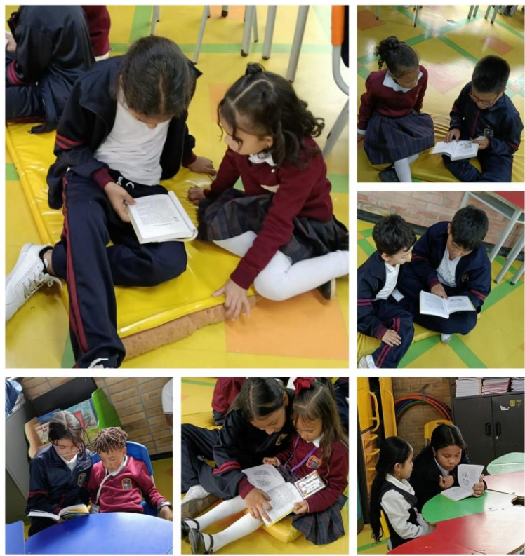
“Día de la Lectura” Estudiantes de Grado Quinto leen cuentos a los estudiantes de Ciclo Inicial. Sede B JT.