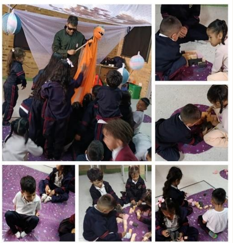
Taller Programa NIDOS “Arte en Primera Infancia” IDARTES Sede B JT.