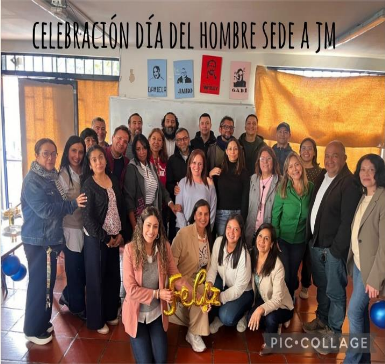
Celebración del “Día del Hombre” Sede A JM.