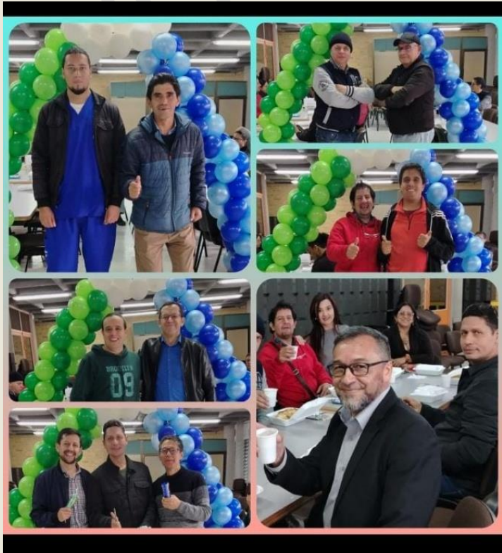
Celebración del “Día del Hombre” Sede C JM.